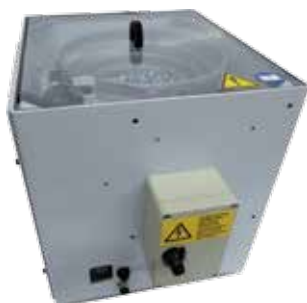
Ausführungen mit Klemmkasten für externe Ansteuerung.