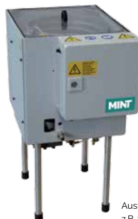
Ausführung mit höherem Standfuß, z.B. wegen Anbau einer Weiche