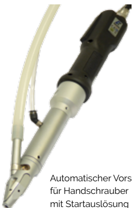
Automatischer Vorschub für Handschrauber mit Startauslösung

Bei Handschraubern wird der Hub automatisch mit dem Starttaster des Schraubers ausgelöst. Für automatisierte Anlagen oder den Einbau in Roboter gibt es einen Vorschub mit Doppelhub, der das Mundstück zudem auf die Schraubstelle platziert.