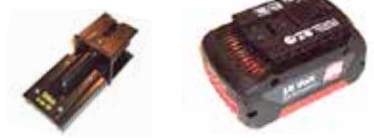
Art.Nr. LAE 3/034 Bosch | 18V Li-Ion