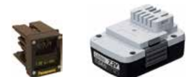
Art.Nr. LAE 3/128 Panasonic | 7,2V Li-Ion