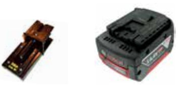
Art.Nr. LAE 3/033 Bosch | 14,4V Li-Ion