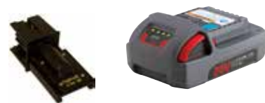
Art.Nr. LAE 3/071 Ingersoll Rand | 20V Li-Ion