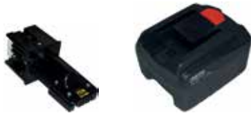
Art.Nr. LAE 3/05 Fein | 10,8V, 14,4V Li-Ion

Für alle gängigen Werkzeugakkus – Einfach austauschbar. Weitere Adapter auf Anfrage.