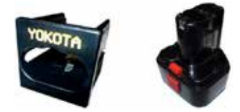
Art.Nr. LAE 1/09 Adapter für Yokota