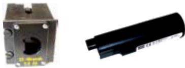
Art.Nr. LAE 3/103 Atlas Copco ST Wrench | 3,75V 2.9Ah Li-Ion