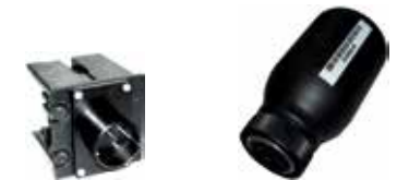
Art.Nr. LAE 3/102 Atlas Copco | ST Wrench | 3,75V 5,2 Ah | Li-Ion