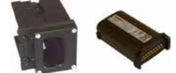
Art.Nr. LAE 3/620 Adapter für Symbol Akku