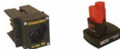
Art.Nr. LAE 3/501 Milwaukee M12