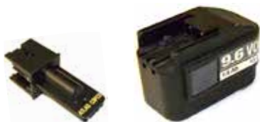
Art.Nr. LAE 2/101 Atlas Copco | System 3000 | 9,6/12V NiCd