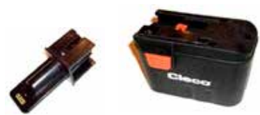
Art.Nr. LAE 3/220 Cleco | 26V Li-Ion