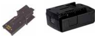
Art.Nr. LAE 3/081 Gesipa | 18V Li-Ion