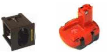
Art.Nr. LAE 3/321 Bosch Exact | NiCd | 90° gedreht