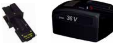
Art.Nr. LAE 3/106 Atlas Copco | 36V Li-Ion