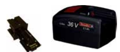
Art.Nr. LAE 3/105 Desoutter | 36V Li-Ion