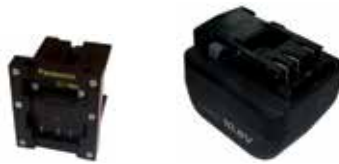
Art.Nr. LAE 3/125 Panasonic | 10,8V Li-Ion