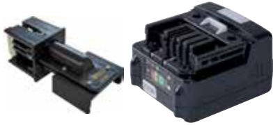
Art. Nr. LAE 3/064 MINT URYU | 11V, 22V, 33V | Li-Ion

Für alle gängigen Werkzeugakkus – Einfach austauschbar. Weitere Adapter auf Anfrage.