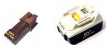
Art.Nr. LAE 2/21 Makita Makstar | 24V NiCd