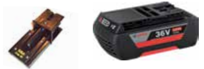
Art.Nr. LAE 3/035 Bosch | 36V Li-Ion