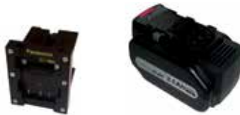
Art.Nr. LAE 3/123 Panasonic | 21,6V Li-Ion