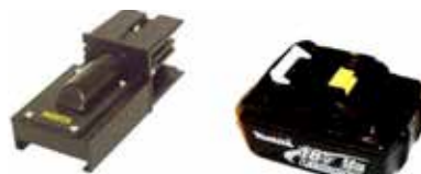
Art.Nr. LAE 3/027 Makita Makstar | 9,6V - 24V NiCd / NiMH, 14,4-18V Li-Ion