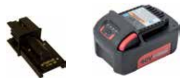
Art.Nr. LAE 3/072 Ingersoll Rand | 40V Li-Ion