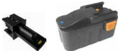
Art.Nr. LAE 2/10MT MINT 12V | NiCd/NiMH