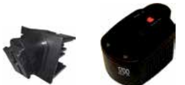
Art.Nr. LAE 2/05 Fein | NiCd/NiMH