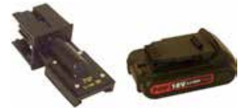
Art.Nr. LAE 3/610 POP/Dewalt | 18V Li-Ion