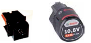
Art.Nr. LAE 3/031 Bosch | 10,8V Li-Ion