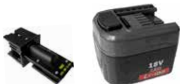
Art.Nr. LAE 3/402MT MINT | AWWPA-180 18V | Li-Ion