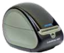
Drucker optional erhältlich

Mit Display und Drehrad für einfache Bedienung