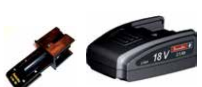
Art.Nr. LAE 3/104 Desoutter | 18V Li-Ion