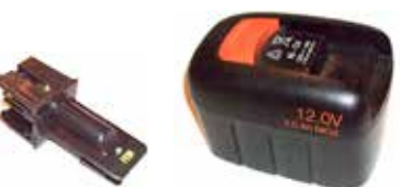
Art.Nr. LAE 2/051 Fein | 12V NiCd