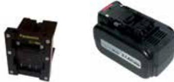
Art.Nr. LAE 3/124 Panasonic | 28,8V Li-Ion