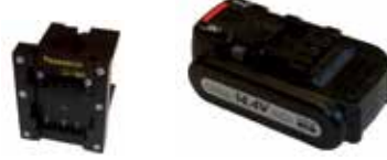
Art.Nr. LAE 3/122 Panasonic | 14,4V Li-Ion