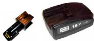
Art.Nr. LAE 3/10 Atlas Copco | 18V Li-Ion