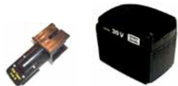
Art.Nr. LAE 3/101 Atlas Copco | 30V Li-Ion